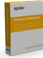
Spider Contract Enterprise