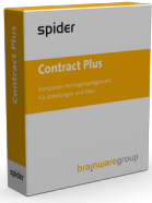
Spider Contract Plus

Spider Contract ist in folgenden Ausführungen erhältlich: